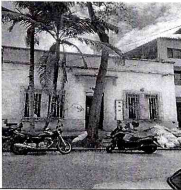
Imagen 1: FRENTE PREDIO