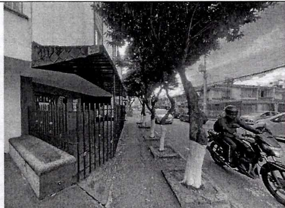
Imagen 2: PERFIL