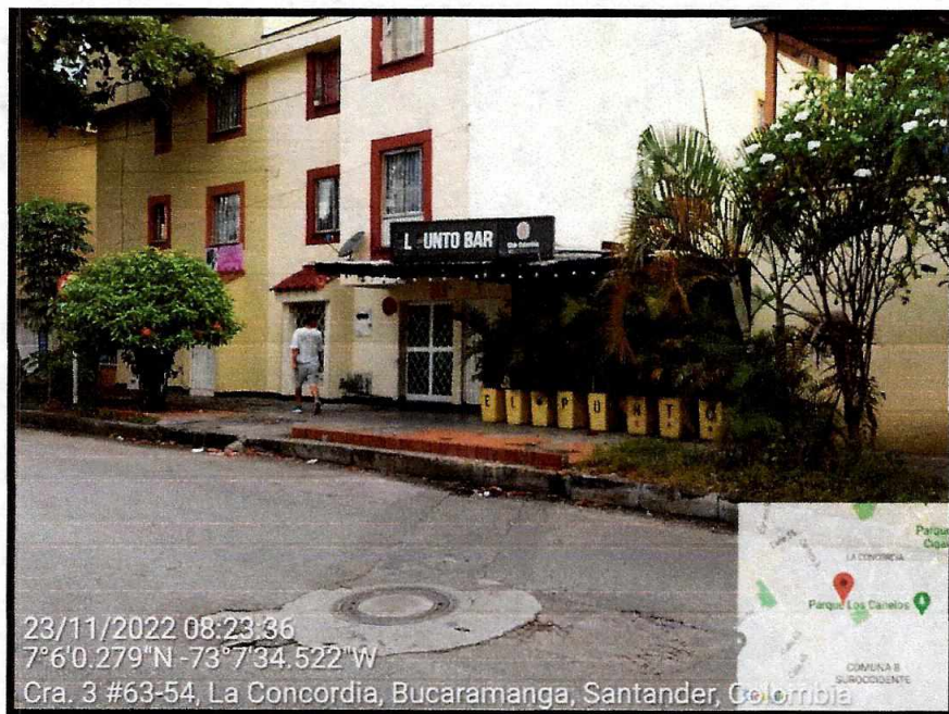
Vista General del sector