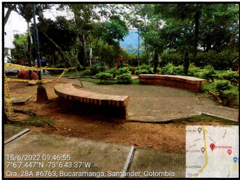
Vista General del sector