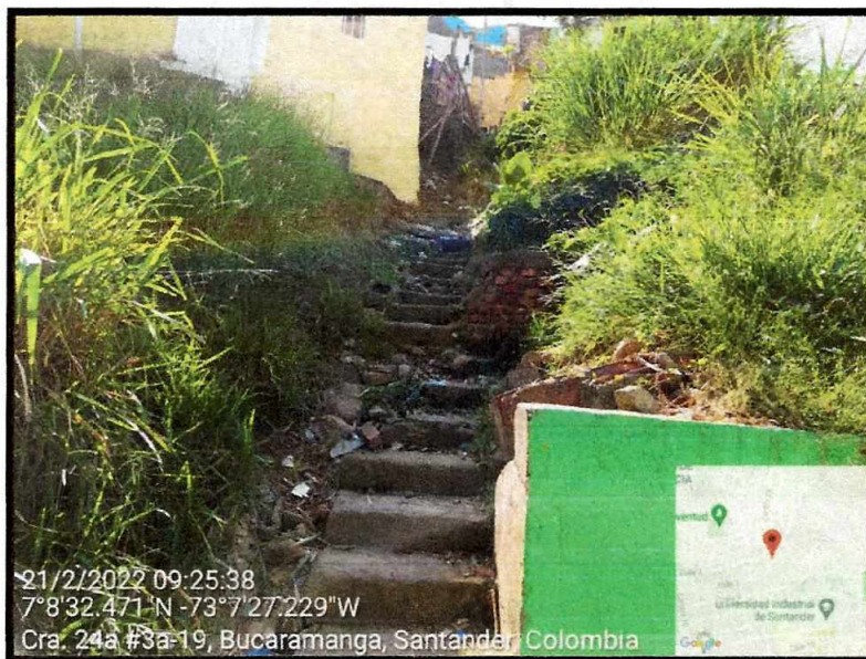
Vista General del sector