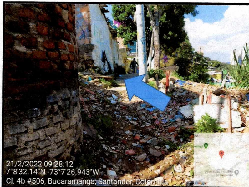
Peatonal por mejorar