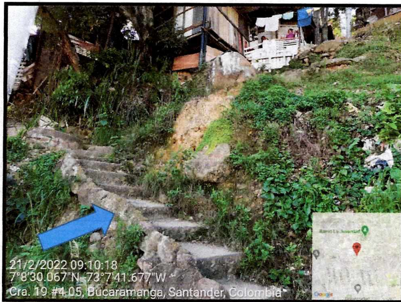
Mejoramiento de escaleras con instalación de pasamanos