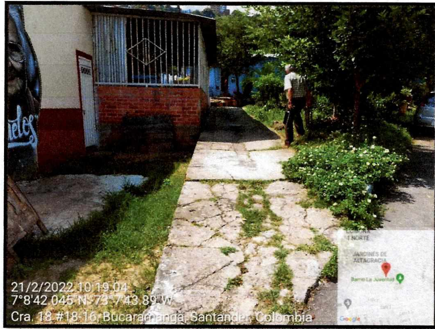
Vista General del sector