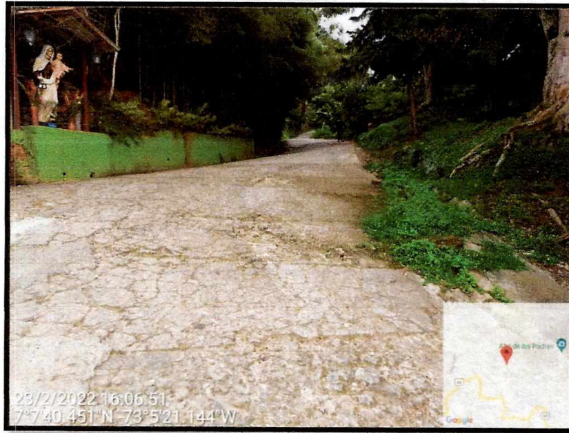
Sector la gruta de la Virgen