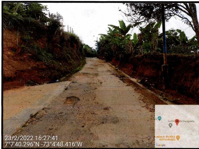
Sector casa roja