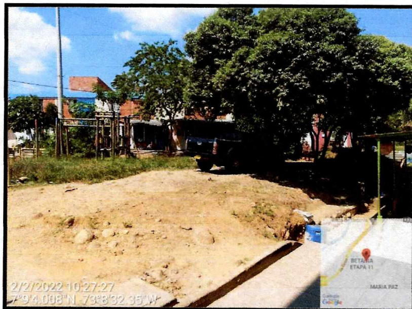
Vista General del sector