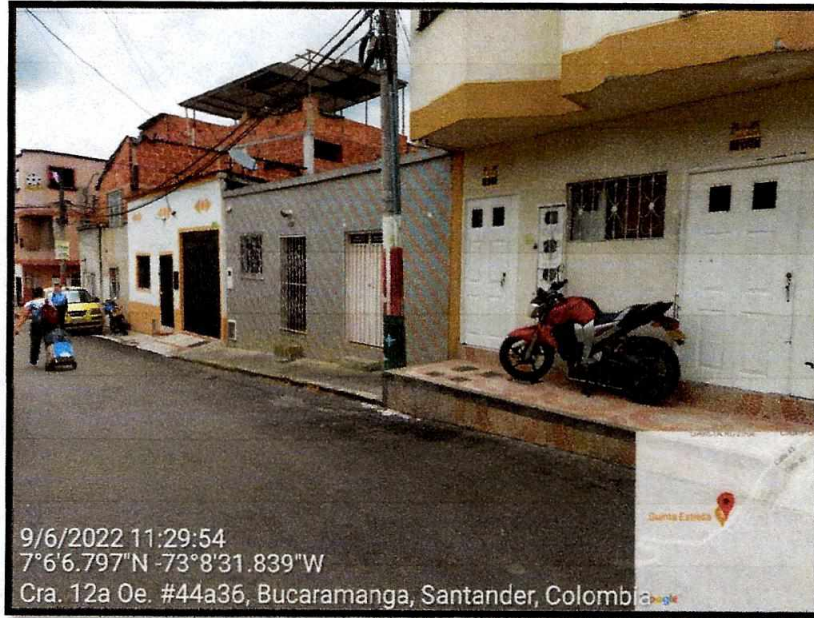
Vista General del sector