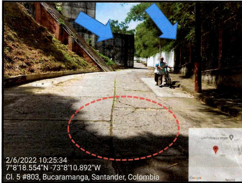
Se observan los tanques de agua y la zona de DRMI