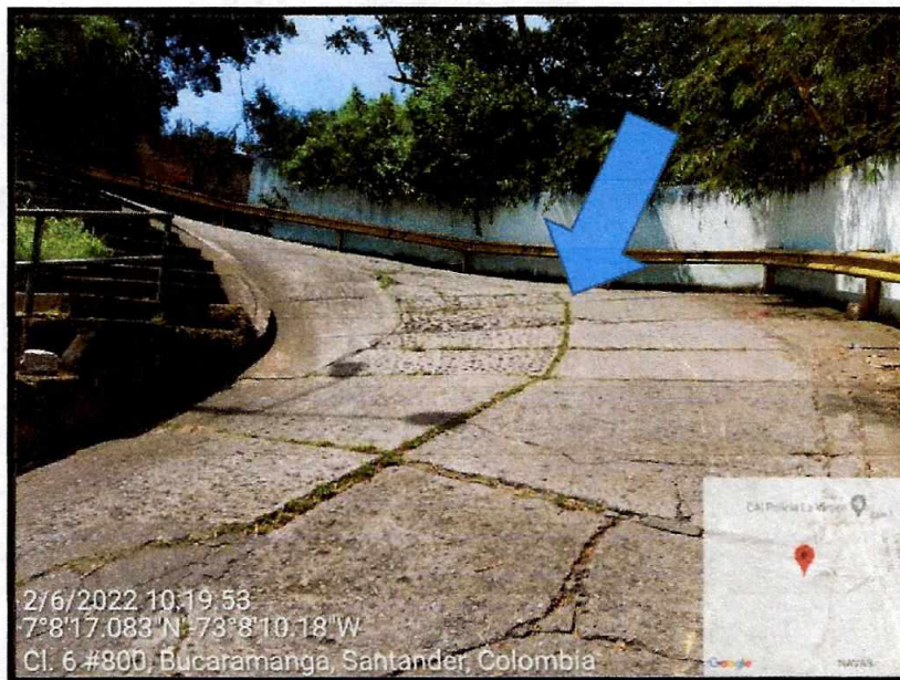
Se observa parte de la vía existente