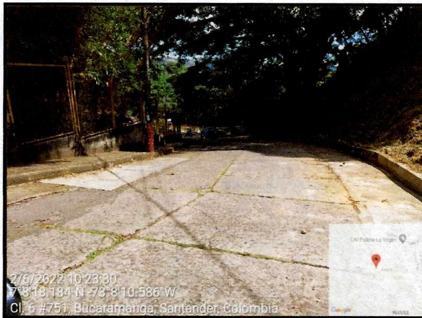
Vista General del sector