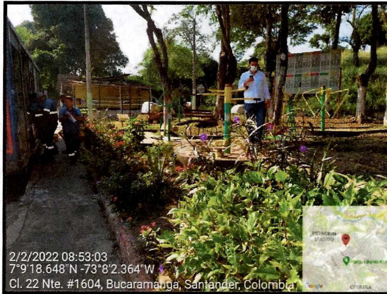
Vista General del sector