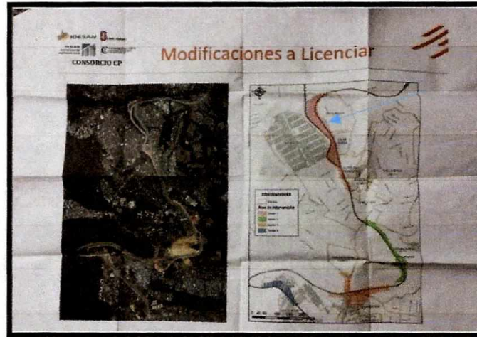
Plano suministrado del Proyecto Doble calzada