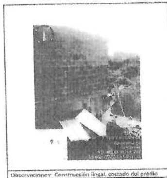
Observaciones: Construcción ilegal, costado del predio