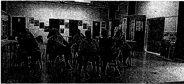
EVIDENCIA CONVOCATORIA REUNIÓN ACUERDO DE BARRIO