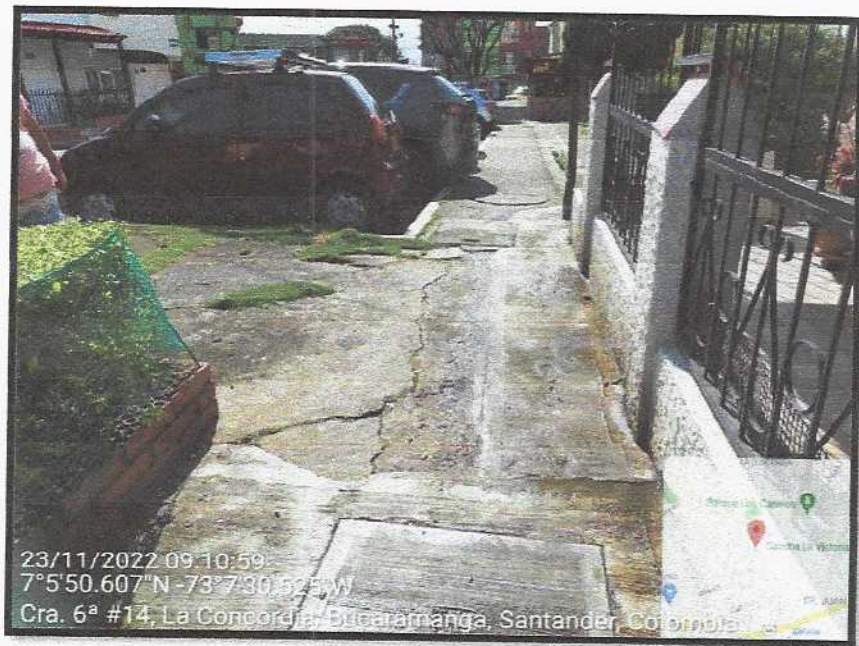
Vista General del sector