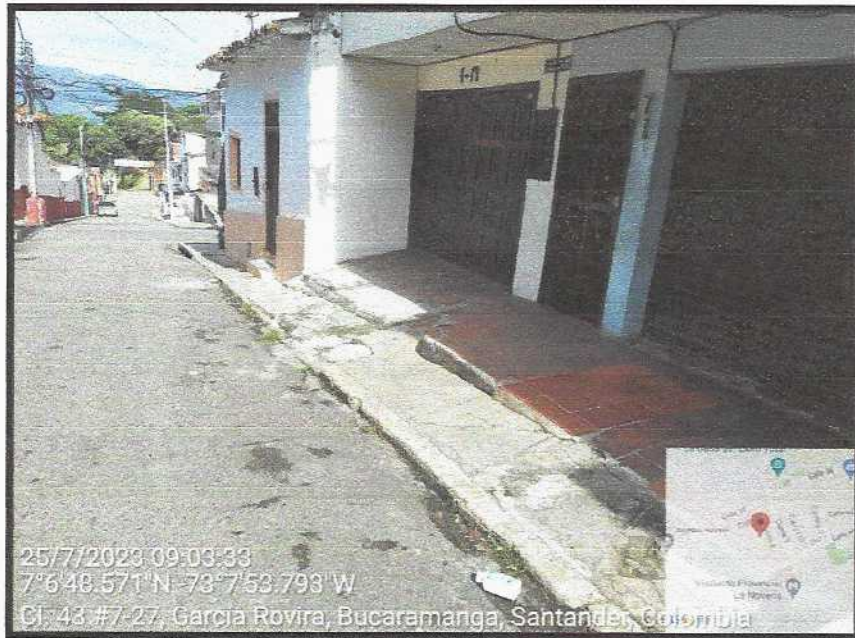
Vista General del sector