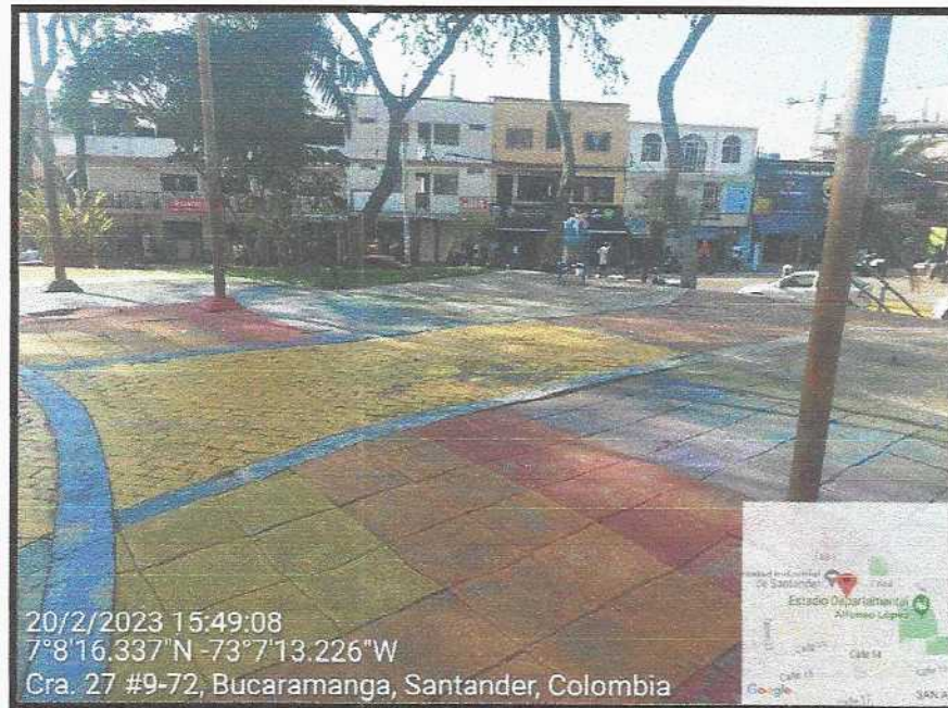
Vista General del sector