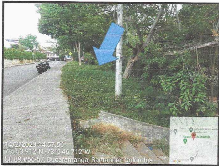
Se observa el sitio propuesto para la construcción del Gimnasio al aire libre