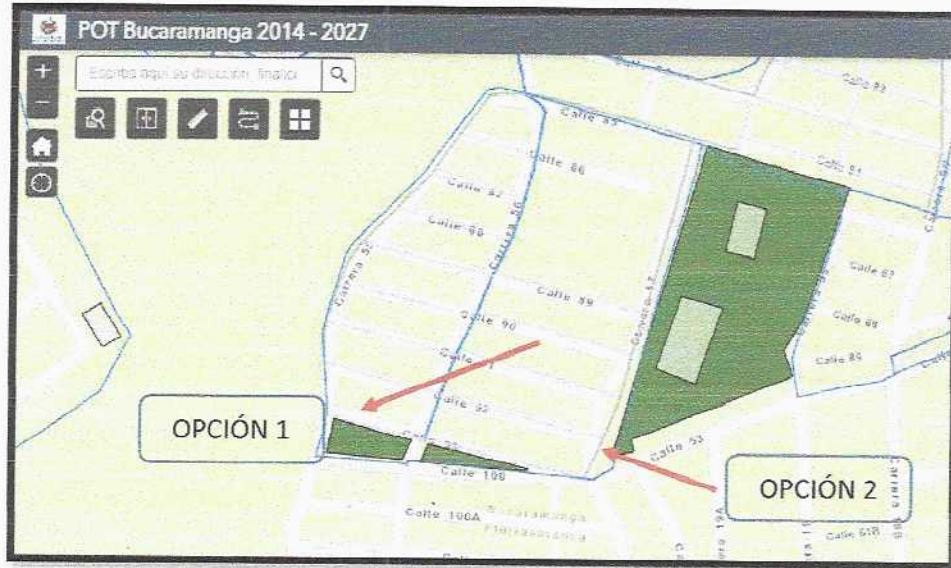
Se ilustra los dos sitios propuestos para la construcción del gimnasio al aire libre