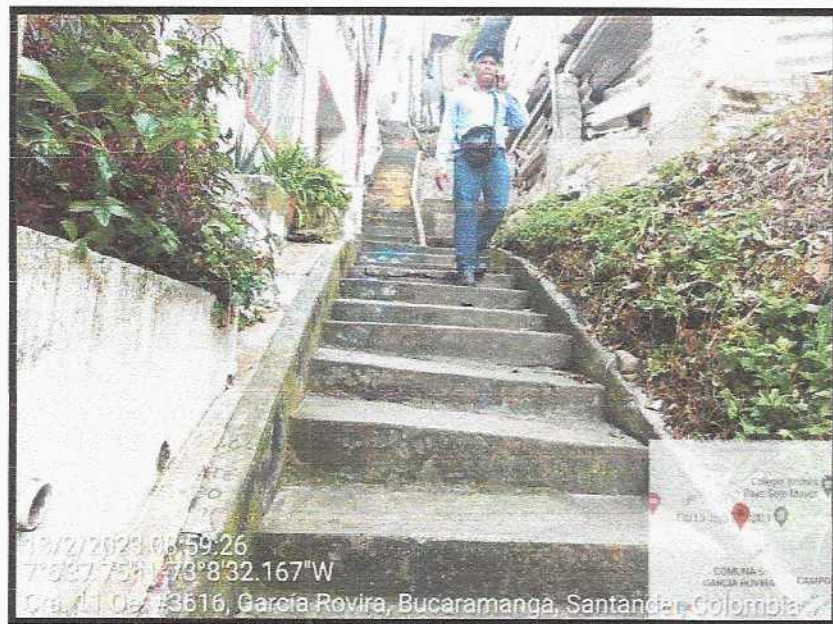
Vista General del sector