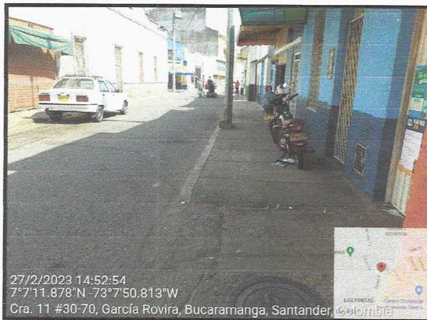
Vista General del sector