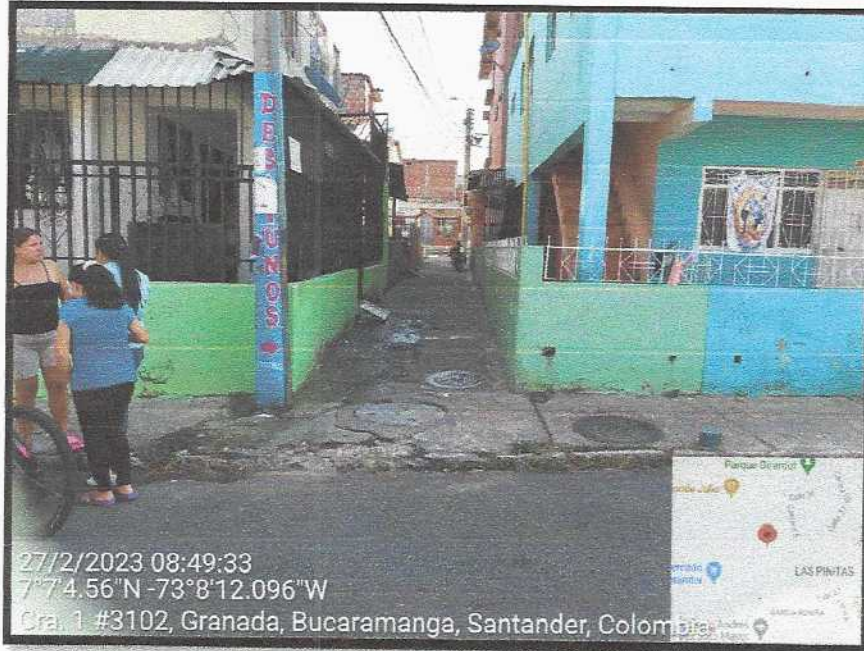
Vista General del sector