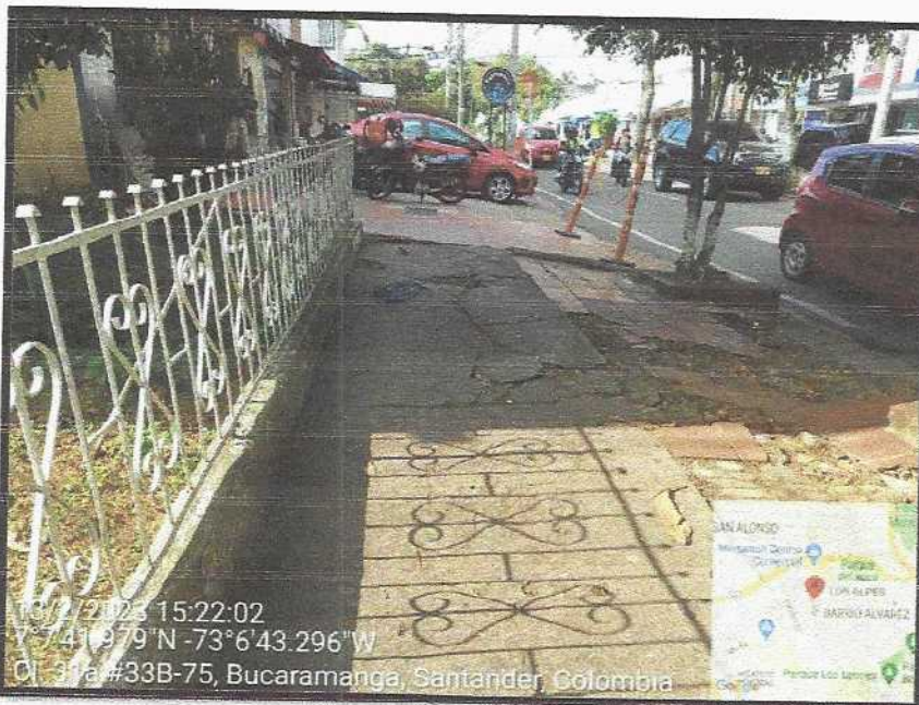
Vista General del sector