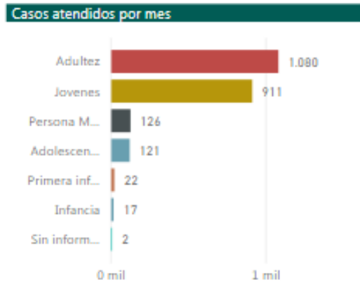
Figura 3. Casos de accidentes de tránsito atendidos por IPS del municipio de Bucaramanga desagregado por curso de vida, A marzo de 2019